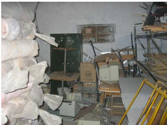
Агуулахын дотор эд барааг төрөлжүүлэн ангилалгүй, эмх цэгцгүй овоолсон байна.

Хурааж авсан барааны үлдэгдэл 2005 оны эцэст 1948,9 сая төгрөг байгаагийн 49,9% нь 972.7 сая төгрөгийн 6 ширхэг барилга объект, 1,5% нь 30.5 сая төгрөгийн цахилгаан бараа, 945.8 сая төгрөгийн бусад бараа байна.