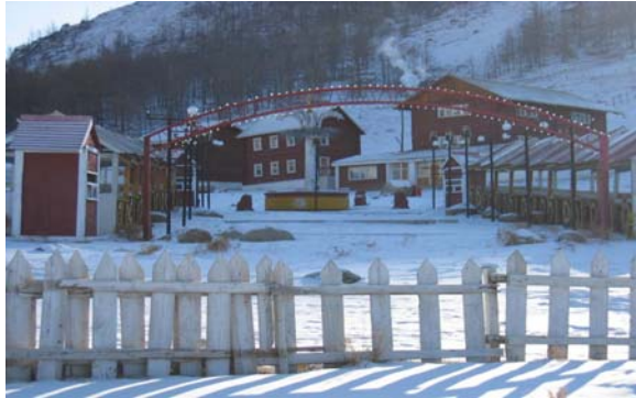
Богд Хан уулын Залаатын аманд байрлах “Залаат” амралт

Үнэ бууруулсны дараа энэ объектыг худалдах зарлалыг дахин гаргаагүй бөгөөд “Монголын алтан аялал” ХХК-тай шууд худалдах, худалдан авах гэрээ хийж, 2006 оны 1 дүгээр сарын 18-нд худалдсан байна.