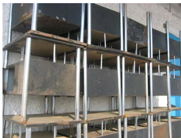
Гадаа хураалттай байгаа сейф