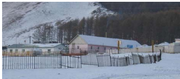
“Сантаун” амралт (наад талын ягаан байшин, гэрүүд)

“Сантаун” амралтын газар өмнө нь “Молор трейд” ХХК-ний эзэмшилд ашиглагдаж байсан бөгөөд гадаад худалдааны чиглэлээр үйл ажиллагаа явуулахаар 2005 оны 3 дугаар сард байгуулагдсан “Таван загал” ХХК 2005 оны 10 дугаар сарын 26-ны өдөр буюу анх тендерийн зар нийтлэгдсэнээс хойш 15 хоногийн дараа “Сантаун” амралтын газрыг өмчлөх эрхийг шилжүүлэн авч, үл хөдлөх хөрөнгийн улсын бүртгэлийн Ү-2203009436 дугаар авсан байна.