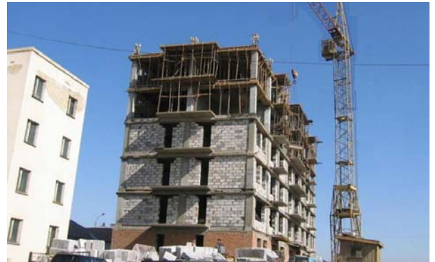
Барилгын ажлын явн (зүүн талаас) 2006/03/14-ний өдөр