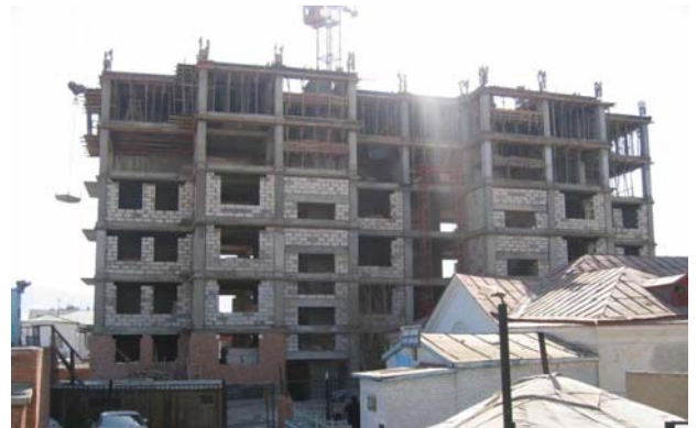
Барилгын ажлын явн (орц талаас) 2006/03/14-ний өдөр

Өнөөдрийн байдлаар 90 айлын орон сууцны 70 гаруй хувийнх нь үнэ буюу 845,1 сая төгрөг НДС-гийн хөрөнгөөр болон НД-ын байгууллагад ажиллагсдын Улаанбаатар банкнаас авсан зээлээр төлөгдөөд байгаа боловч “Молор трейд” ХХК-ний тодорхойлсноор барилгын ажил 2005 оны 11 дүгээр сараас түр зогсжээ. Уг 9 давхар орон сууцны барилгын 6 давхрын өрлөг бүрэн хийгдээгүй байгаагаас үзэхэд гэрээт хугацаанд буюу 2006 оны 3 дугаар сард ашиглалтад орох ямар ч боломжгүй байна