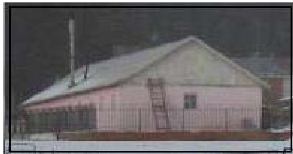
“Сантаун” амралтын байшин, төмөр хашаа