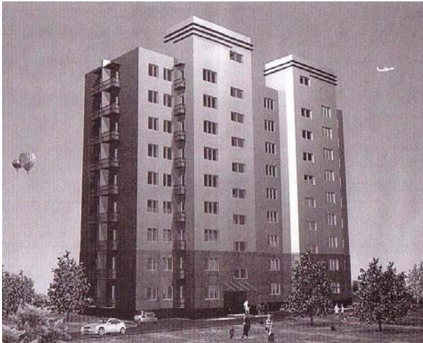
Баригдах 90 айлын орон сууцны барилгын зураг

банкнаас орон сууц авах ажиллагсдын нэр дээр зээл авахуулан, төлүүлжээ. Үүнээс гадна 2005 оны 7 дугаар сараас 10 дугаар сарын хооронд Дарханы Төмөрлөгийн үйлдвэрээс 188,2 сая төгрөгийн арматурын төмрийг тус компанид олгуулаад байгаа билээ.