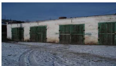
Зураг 3. Гаражын гадаад байдал

2.10 РТХЭГ-ын даргын 2005 оны 11 дүгээр сарын 04-ний өдрийн 275 дугаар тушаалаар 15,6 сая төгрөгийн гражийн барилгыг хашааны хамт 20,0 сая төгрөгөөр “Коума” ХХК-д худалджээ.