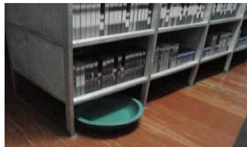
Зураг 3. Сан хөмрөгийн хадгалалтын байдал

2.24 Радиогийн хөгжмийн эргэлтийн сан хөмрөгт ардын дуу 4000, зохиолын дуу 10000, хөгжмийн уран сайхны нэвтрүүлэг 300, гадаад бичлэг 10000 зэрэг нийт 25000 орчим хальс хадгалагдаж байна. Радиогийн эфирийн тоног төхөөрөмж CD шууд ашиглах боломжгүй учраас хальс руу хөрвүүлэн хэрэглэж байна.