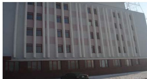
Зураг 2 . “Супер-Вижн” ХХК-д худалдсан дуусаагүй барилга ашиглалтанд орсон байдал

2.9 РТХЭГ-ын даргын 2005 оны 6 дугаар сарын 30-ний өдрийн 152 дугаар тушаалаар 482,9 сая төгрөгийн өртөгтэй контор, студийн зориулалттай дуусаагүй барилгыг үнэ бууруулж 150,0 сая төгрөгөөр “Супер Вижн” ХХК-д худалджээ.