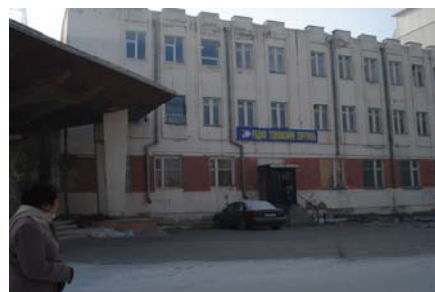
Зураг 1. Радио, телевизийн дээд сургуулийн барилга

2.7 РТХЭГ-ын даргын 2005 оны 10 дугаар сарын 13-ны өдрийн 246 дугаар тушаалаар 147,8 сая төгрөгийн өртөгтэй барилгын хэсгийг Радио, телевизийн дээд сургуульд үнэ төлбөргүй шилжүүлжээ.