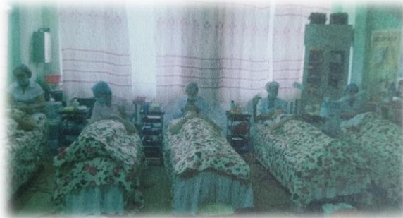
Гагнуур, гоо заслын мэргэжил олгох сургалтын үйл явц