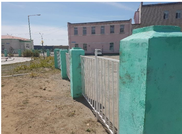
Цагаан эрэг цогцолбор

3.7 Харин ашиглалтад хүлээн аваад нэг жил ч болоогүй байхад Сүхбаатар сумын 7-р багийн хүүхдийн тоглоомын талбайн сагсны 1 талын самбар хагарч, хүрээ эвдэрсэн, Цагаан эрэг цогцолборын төмөр хашаа болон бетонон баганы тосон будаг, эмульс халцарч, өнгө үзэмж нь муудсан, засвар хийсэн эсэх нь мэдэгдэхээргүй байдалтай болсон байлаа. Цаашид орон нутгийн төсвийн хөрөнгө оруулалтаар хэрэгжсэн нийтийн эзэмшлийн тоглоомын талбай болон цогцолборын хөрөнгө оруулалтын ажлуудад ашиглаж, хэрэглэсэн түүхий эд материал, тоног төхөөрөмжийн чанарын байдалд захиалагчийн зүгээс тавих хяналт шалгалтын үр нөлөөг тогтмол сайжруулж байх нь зүйтэй юм.