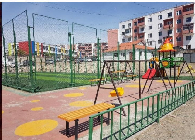
/Сүхбаатар сумын Шарын 11,12,13 байрны дунд тоглоомын талбай /

3.7 Харин ашиглалтад хүлээн аваад нэг жил ч болоогүй байхад Сүхбаатар сумын 7-р багийн хүүхдийн тоглоомын талбайн сагсны 1 талын самбар хагарч, хүрээ эвдэрсэн, Цагаан эрэг цогцолборын төмөр хашаа болон бетонон баганы тосон будаг, эмульс халцарч, өнгө үзэмж нь муудсан, засвар хийсэн эсэх нь мэдэгдэхээргүй байдалтай болсон байлаа. Цаашид орон нутгийн төсвийн хөрөнгө оруулалтаар хэрэгжсэн нийтийн эзэмшлийн тоглоомын талбай болон цогцолборын хөрөнгө оруулалтын ажлуудад ашиглаж, хэрэглэсэн түүхий эд материал, тоног төхөөрөмжийн чанарын байдалд захиалагчийн зүгээс тавих хяналт шалгалтын үр нөлөөг тогтмол сайжруулж байх нь зүйтэй юм.