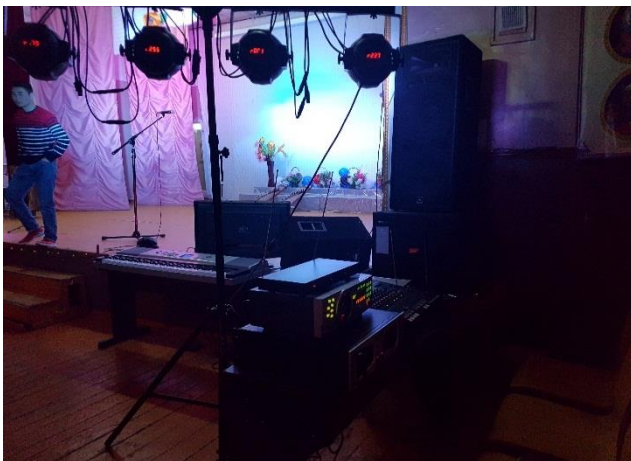
/Жавхлант сумын Соёлын төвийн хөгжим хэрэгсэл, тоног төхөөрөмж /

баталгаажуулахад 2017 онд улс, орон нутгийн хөрөнгө оруулалтын эх үүсвэрээр бүрэн санхүүжилт олгосон бүх ажлуудыг ашиглалтад хүлээн авсан байсан бөгөөд ашиглагч байгууллагын зүгээс ямар нэгэн гомдол, санал гараагүй болно.