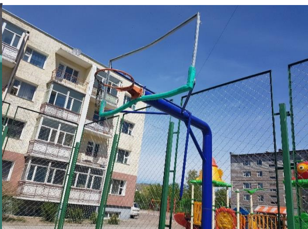
7-р багийн тоглоомын талбай