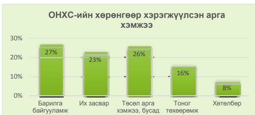
График 1: ОНХС-ийн хөрөнгөөр хэрэгжүүлсэн ТАХ

Графикаас харахад: Барилга байгууламж 27 %, Их засвар 23 %, Төсөл арга хэмжээ бусад 26%, Тоног төхөөрөмж 16 %, Хөтөлбөрт 8% тус тус зарцуулсан байна.