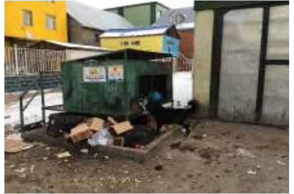
"Хөгийн сав" арга хангаа-Мөрөн сум