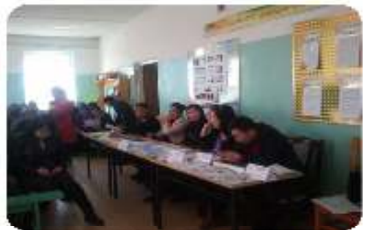
"Эрх зүйн хөтөч" хөтөлбөр