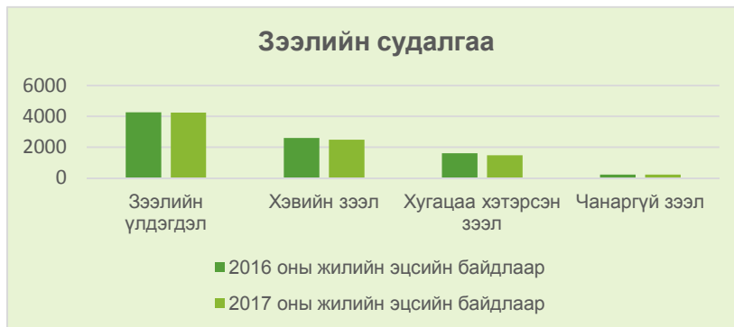
График- 2: Зээлийн судалгаа

Графикаас харахад: Нийт зээлийн 35 орчим хувь буюу 1,487.7 сая төгрөгийн зээл хугацаа хэтэрсэн, 5 орчим хувь буюу 218.4 сая төгрөгийн зээл зориулалт бус зүйлд зарцуулагдаж төлөгдөх боломжгүй зэргээс чанаргүй зээлд тооцогдсон байна.