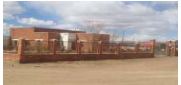
ОНХС-ийн хөрөнгөөр 17 гүний худгийн усны шаацны савыг сольсон.