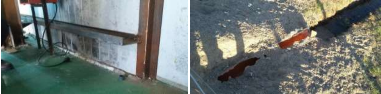
Зураг 5: Цэвэрлэх байгууламжийн ажлын гүйцэтгэл

Ханын битүүмжлэл, цэвэрлэсэн ус зайлуулах хоолой хөлдсөний улмаас хагарсан байдал