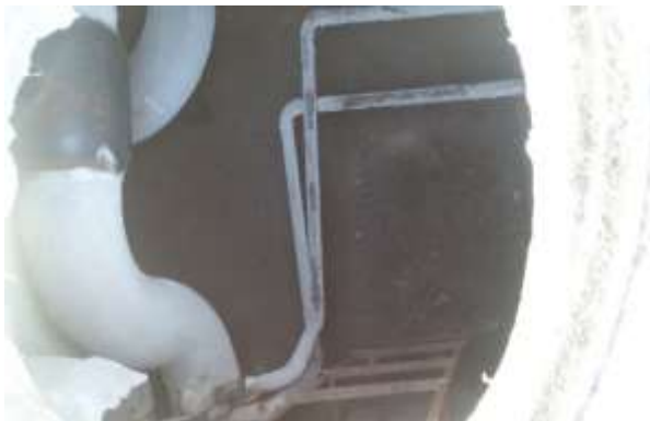
Шугам хоолойн дулаалгын байдал