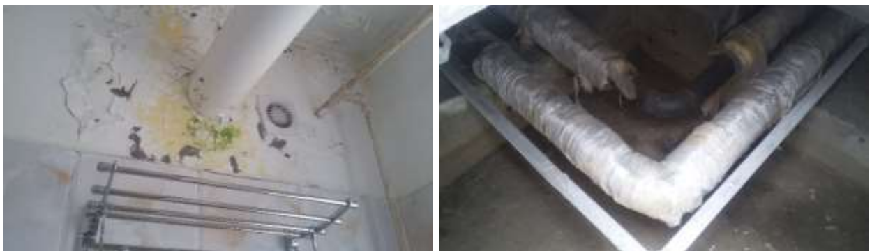
Зураг 6: Халуун усны барилгын ажлын гүйцэтгэл

Халуун усны барилга: Чийг ихтэй байгаагаас дотор засал ховхорч мөөгөнцөр үүсэх шинж тэмдэг илэрсэн байна. Агааржуулалт муу ажиллаж, цанталт үүсэн агааржуулалтаас ус гоожсон байна. Халуун усны гадна цэвэр усны шугам дулаалгагүй учраас хөлдөлт үүссэн байна.