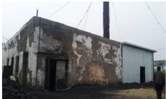
Уурын зуухны барилгын гадна талын өнгөлгөө

Ахуйн үйлчилгээний барилга: Батлагдсан зураг, төсөвтэй тулган шалгахад дараах ажлууд зөрүүтэй хийгдсэн байна. Үүнд: Гадна шат довжоог зургийн дагуу хийгээгүй, агааржуулалтын системийг өрлөгөөр хийхээр зурагт тусгасныг хуванцар хоолойгоор хийсэн байна.