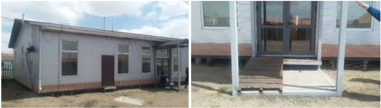
Агааржуулалтын систем болон гадна довжооны гүйцэтгэл

Авто замын ажил: Сумын төвд баригдсан авто замын дагуу шуудуу татахаар зурагт тусгасан ч энэхүү ажлын оронд уулын үерийг зайлуулах шуудуу татсан байна. Өөрчлөлт хийсэн зохиогчийн зөвшөөрөл байхгүй ба УК-ын 2017 оны 09 дүгээр сарын 29-ний өдрийн хуралдааны тэмдэглэлд “Төслийн баг хэлэлцэж байгаад шилжүүлэн хийлгэсэн” гэж бичсэнээс өөр шийдвэргүй байна. Энэ нь: Барилгын тухай хуулийн 14 дүгээр зүйлийн 14.1.1-дэх “Зураг төслийн дагуу баригдсан байх” гэсэн заалтыг зөрчсөн байна.