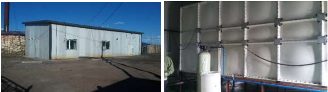
Зураг 7: Усан сангийн барилгын ажлын гүйцэтгэл

Ус нөөцлөх сав /Залгаасаар ус алдалттай/