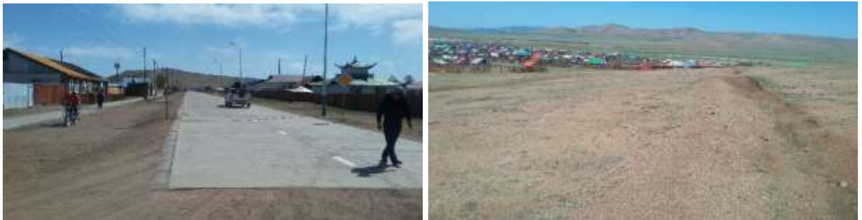
Авто зам дагуух шуудууг өөрчлөн ууланд шуудуу татсан байдал