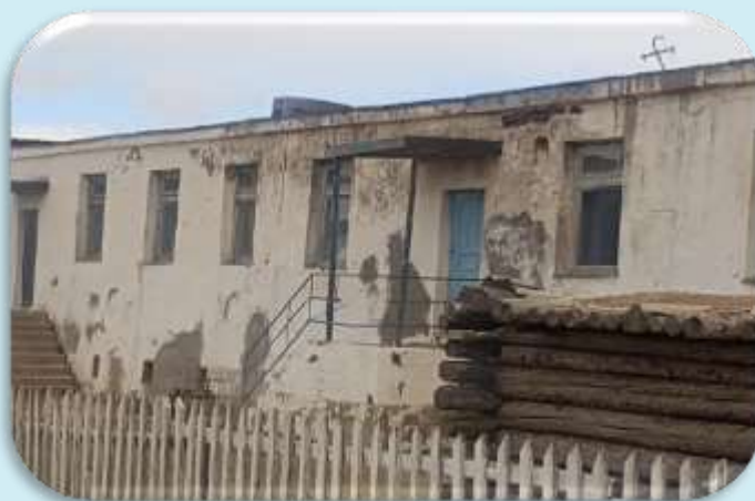
Могойн хүүхдийн цэцэрлэгийн байр

ЦЭЦЭРЛЭГ СУМЫН ИТХ, ЗАСАГ ДАРГА НЬ ЧИГ ҮҮРГЭЭ ХАНГАЛТГҮЙ ХЭРЭГЖҮҮЛСЭН БАЙНА.