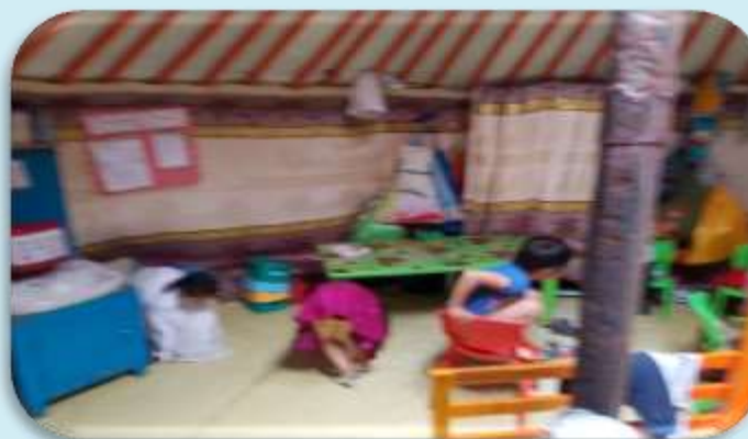
Могойн хүүхдийн гэр цэцэрлэг