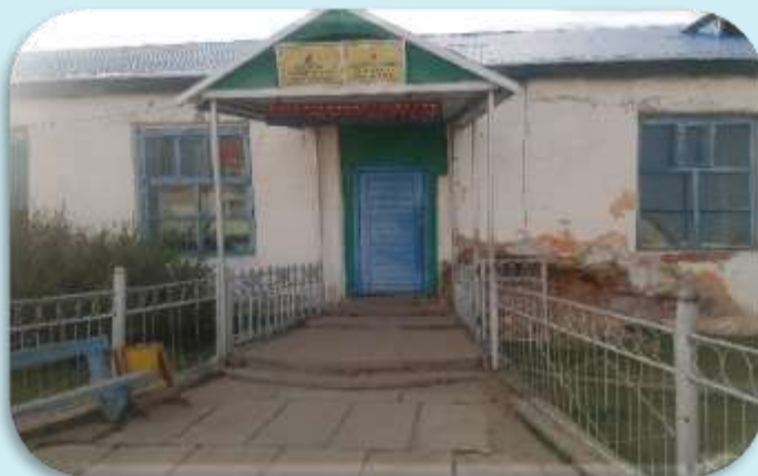
ЗДТГ-ын байр –Цэцэрлэг сум

Монгол Улсын Ерөнхий аудиторын 2018 оны А/125 дугаар тушаал, Хөвсгөл аймаг дахь Төрийн аудитын газрын 2018 онд хийх аудитын төлөвлөгөөний дагуу гүйцэтгэсэн гүйцэтгэлийн аудитын тайлан