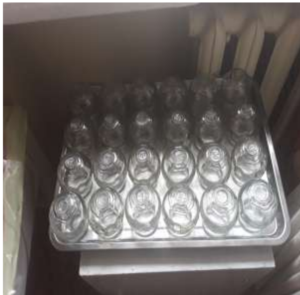
Сансар эмнэлэгт нийлүүлсэн эмнэлгийн хэрэгсэлүүд