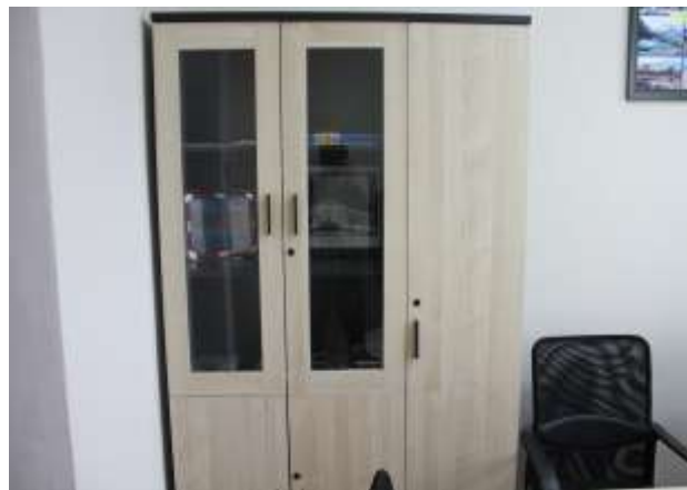
Аймгийн ЗДТГазарт нийлүүлсэн конторын тавилга