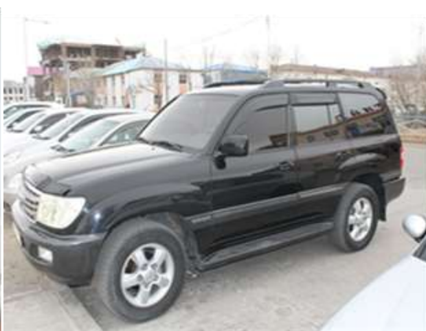
Аймгийн ЗДТГазарт нийлүүлсэн автомашин, тавилга, хэрэгсэл

Хэрэгжсэн төсөл арга хэмжээнүүдийг хэрэгжилтэнд захиалагчийг төлөөлж үе шатны ажлын гүйцэтгэлд ЗДТГазрын Хөгжлийн бодлого төлөвлөлтийн хэлтсийн дарга, Барилга захиалагчийн албаны дарга, инженерүүд газар дээр нь хяналт тавьж, зураг төсвийн дагуу хийгдэж байгаа эсэхэд хяналт тавьж, илэрсэн зөрчил дутагдлыг арилгуулах талаар тэмдэглэл хөтөлж баримтжуулсан байна.