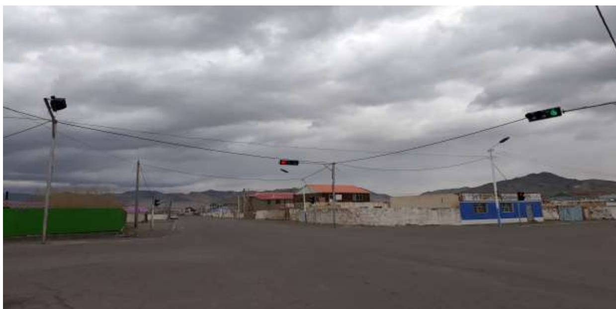
Өлгий сумын 8-багийн 4 замын уулзварын гэрлэн дохио