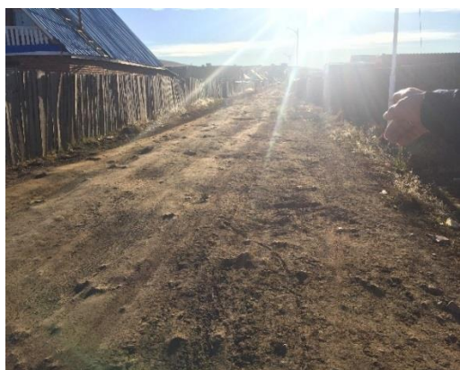
Зураг 3. Толгодын 32-р гудамж

Баян-Өндөр сумын ОНХС-ын хөрөнгөөр хийгдэх ТАХ-ны жагсаалтанд яргуйт багийн толгодын 32-р гудамжны шороон зам сайжруулах ажил батлагдсан байна. 32-р гудамжны шороон зам сайжруулах ажил 2017 онд хийгдсэн байсан тул оронд нь 35-р гудамжийг зассан байна.