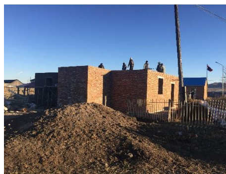
Зураг 2. Одоо баригдаж байгаа халуун усны барилга-Жаргалант сум