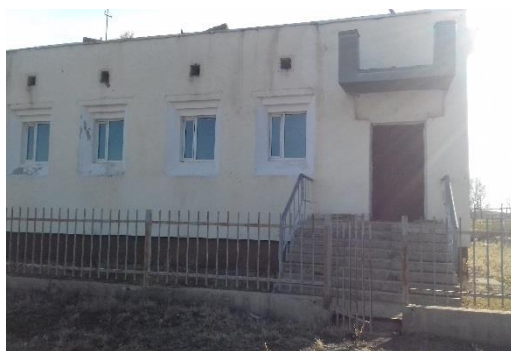
Зураг 1. Усан сангийн худаг