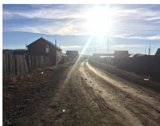
Зураг 4. Толгодын 35-р гудамж

Энэ нь Төсвийн тухай хуулийн 29.4 “Хөрөнгө оруулалтын төсөвт ТЭЗҮ хийгдсэн, зураг төсвөө батлуулсан, хуульд заасан бусад зөвшөөрөл олгогдсон төсөл арга хэмжээг тусгана.” гэж заасныг зөрчсөн байна.