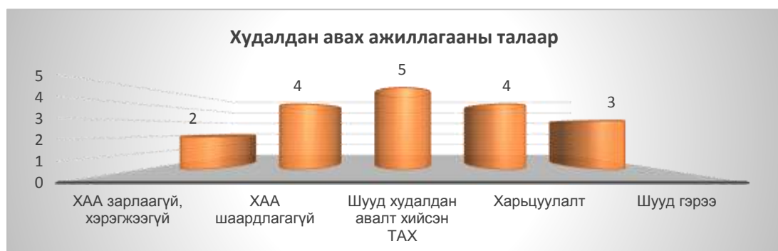
График1: Орон нутгийн төсвийн хөрөнгө оруулалтын ХАА /тоогоор/

Зөвлөх үйлчилгээний аргаар өмнөх онд хэрэгжсэн Бигэр сумын Өөшийн услалтын системийн зураг төсвийн сонгон шалгаруулалт хийсэн байна.