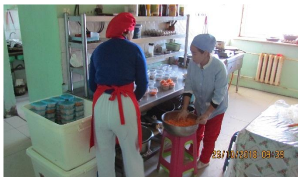
Алтанчуу ХХК-ний ажлын байр

Журмыг мөрдөж ажиллаагүй эмчид хариуцлага тооцуулахаар сургуулийн захиралд хариуцуулан албан шаардлага бичив.