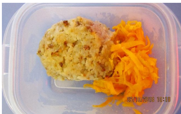
Алтанчуу ХХК-ийн тештель

6.3.3-д Шаардлага хангахгүй хүнсний бүтээгдэхүүнийг буцаах гэсэн заалтыг тус тус зөрчсөн байна.