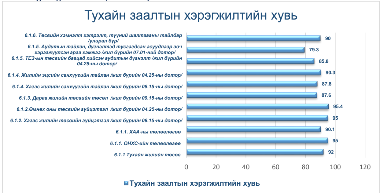
График-1 Шилэн дансны тухай хуулийн 6 дугаар зүйлийн 6.1-д заасан мэдээллийг тус хуулийн 3 дугаар зүйлийн 3.1.1, 3.1.2-д заасан байгууллагууд мэдээлсэн хэрэгжилтийн хувь

Шилэн дансны тухай хуулийн 6 дугаар зүйлийн 6.4.1 3 -д заасны дагуу 244 байгууллагаас 13 байгууллагад төсөвт өөрчлөлт орсон тухай мэдээллээ бүрэн байршуулсан байна.