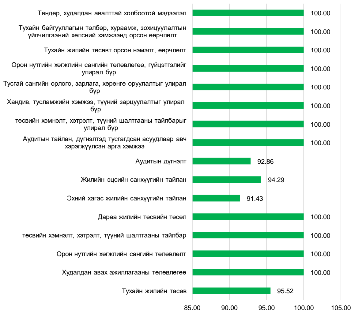
Мэдээлэл байршуулсан байдлыг байгууллагын тоонд харьцуулан хувиар харуулбал

Графикаас харахад: дээрх 16 үзүүлэлтээс 4 үзүүлэлтийн хэрэгжилт 91.4-95.5%-тай байгаа бөгөөд дараах байгууллагууд мэдээлэл дутуу байршуулсантай холбоотой байна. Үүнд: