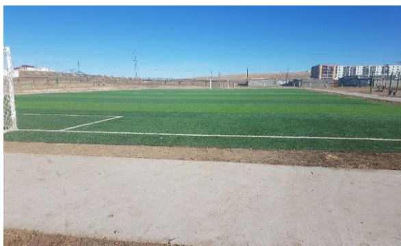
/Сайхан сум. Хөлбөмбөгийн талбай/