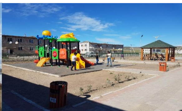
/Орхонтуул сум. Тоглоомын талбай/