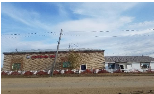
/Хүдэр сум. Соёлын төвийн өргөтгөл/

Аудитын явцад 14 суманд хийгдсэн төсөл, арга хэмжээний хэрэгжилтийг объект дээр нь очиж танилцахад ашиглагч байгууллагын зүгээс ямар нэгэн гомдол, санал гараагүй болно.