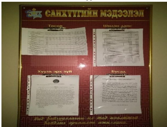
“Сэлэнгийн долгио чуулга”