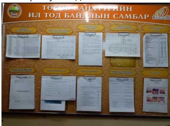
Ерөө сумын ЗДТГ