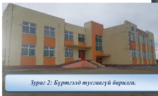
Зураг 2: Бүртгэлд тусгаагүй барилга.

чийгтэй, эмульс халтартсан чанар байдлын хувьд хангалтгүй байжээ.