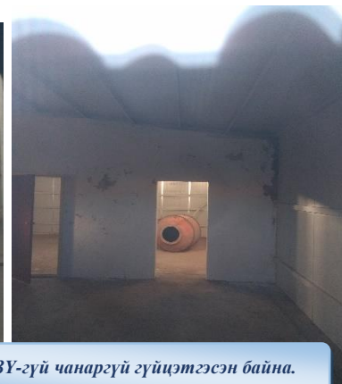
Зураг 1: ТЭЗҮ-гүй чанаргүй гүйцэтгэсэн байна.