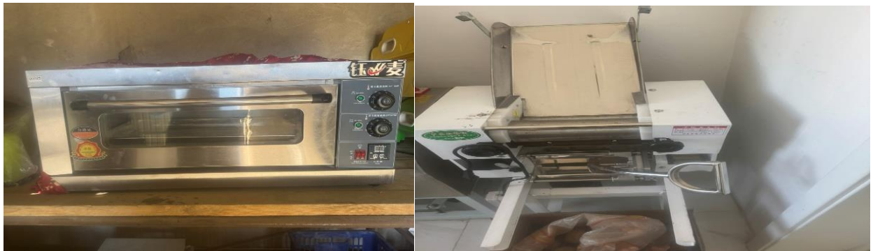
Зураг №9 Өлгий сумын 29 дүгээр цэцэрлэгийн духов, гурил зурагч