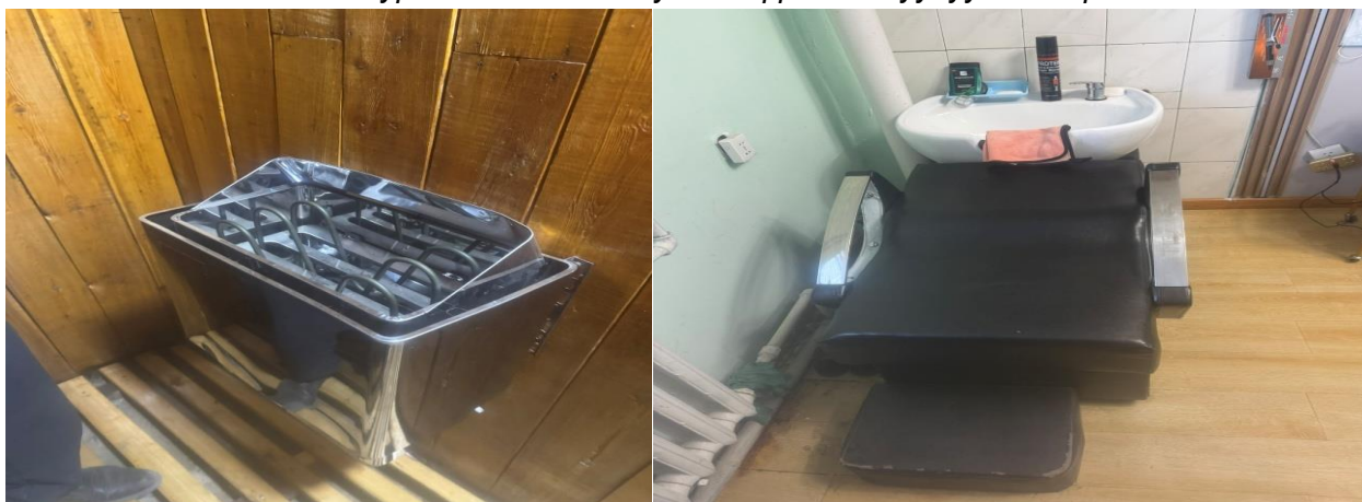
Зураг №5 Алтай сумын ерөнхий боловсролын 1 дүгээр сургуулийн халуун ус