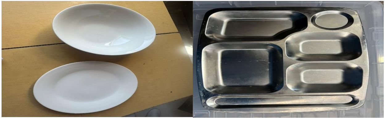
Зураг №8 Цэцэрлэгүүдэд нийлүүлсэн таваг