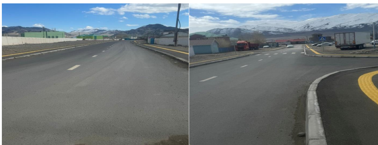
Зураг №2 Өлгий сумын төвд шинээр баригдсан 1 км авто зам