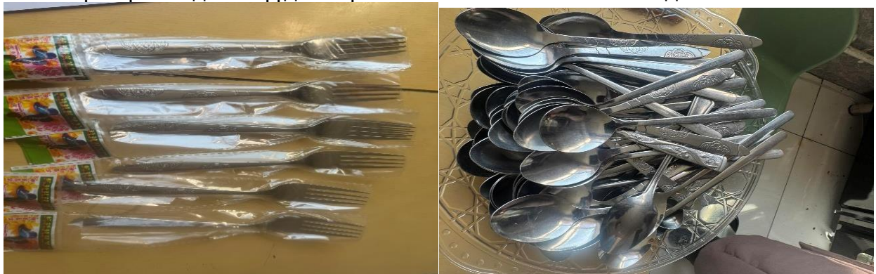
Зураг №7 Цэцэрлэгүүдэд нийлүүлсэн сэрээ, халбага

Дээрх цэцэрлэгүүдэд нийлүүлсэн 2.7 сая төгрөгийн 400 ширхэг хүүхдийн хоолны иж бүрдлийн таваг нь том хэмжээтэй, нэг ширээнд 6 ширхгээс илүү тавих боломжгүйгээс зарим цэцэрлэгүүд ашиглаагүй байна.