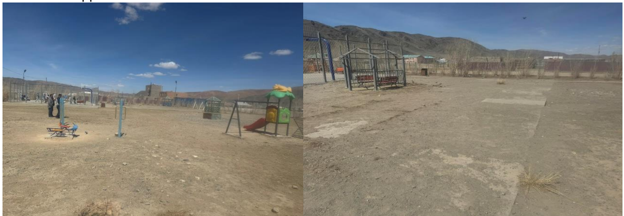
Зураг №4 Алтай сумын хүүхэд залуучуудын парк