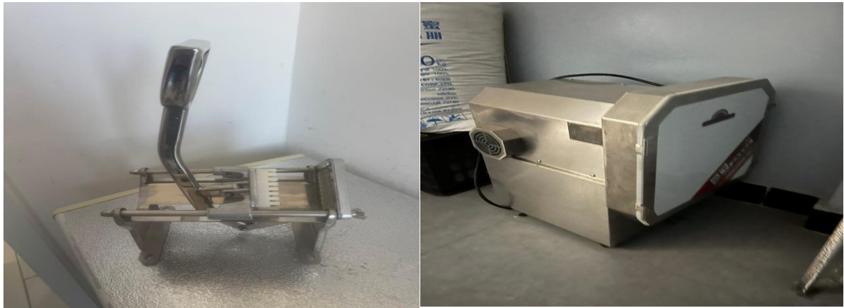
Зураг № 10 Өлгий сумын 17 болон 30 дугаар цэцэрлэгүүдийн ногоо хэрчигч