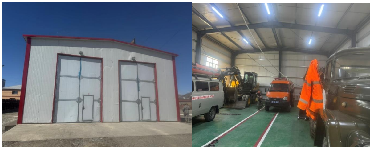
Зураг №1 Онцгой байдлын газрын гарааш