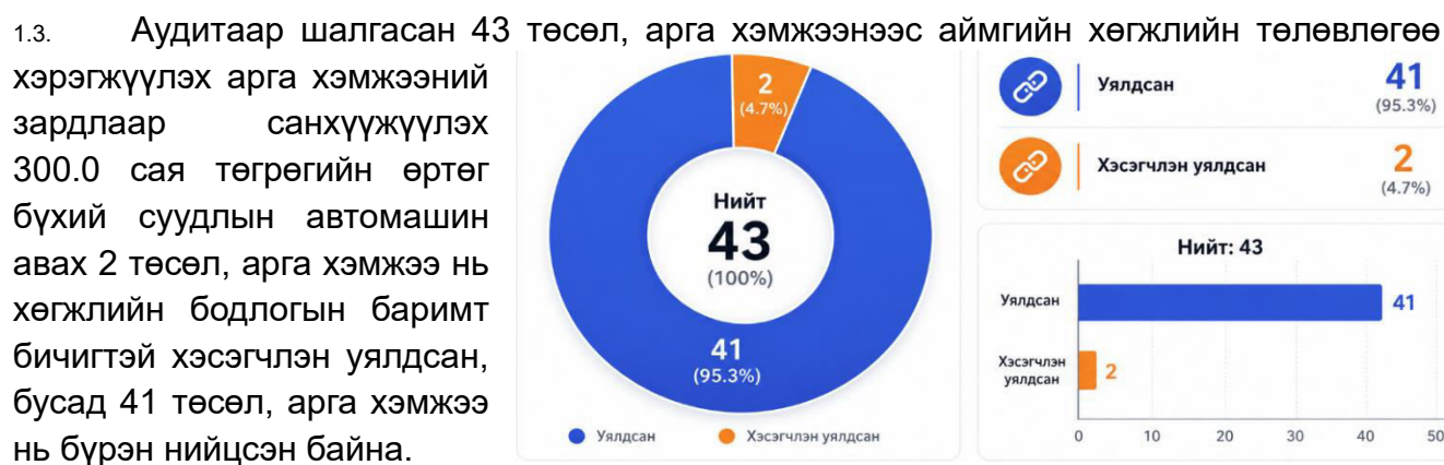
Дүрслэл 1. Хөгжлийн бодлоготой уялдсан байдал