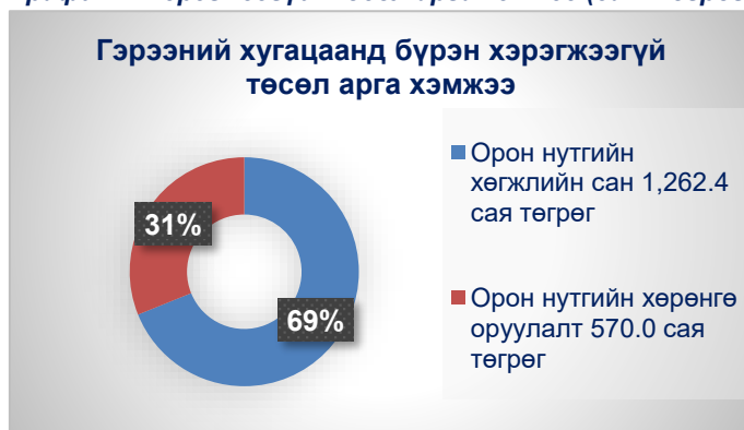
График 2. Хэрэгжээгүй төсөл арга хэмжээ (сая төгрөгөөр)

Орон нутгийн хөрөнгө оруулалт, авто замын сан, аймаг, сумдын ОНХС-ийн хөрөнгөөр хэрэгжүүлэхээр төлөвлөсөн зарим төсөл арга хэмжээ огт хийгдээгүй, зарим төсөл арга хэмжээ гэрээний хугацаанд бүрэн дуусаагүй болон Сангийн яамнаас санхүүжилтийн эрхийг нээгээгүйгээс үлдэгдэл санхүүжилтийг олгоогүй нь гол нөлөө үзүүлсэн байна.