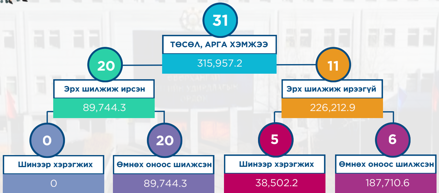
Эрх шилжиж ирсэн TAX-20 /ТЭЗ/

Үүнээс 89,744.3 сая төгрөгийн 20 төсөл, арга хэмжээ нь өмнөх оноос шилжиж ирсэн байна