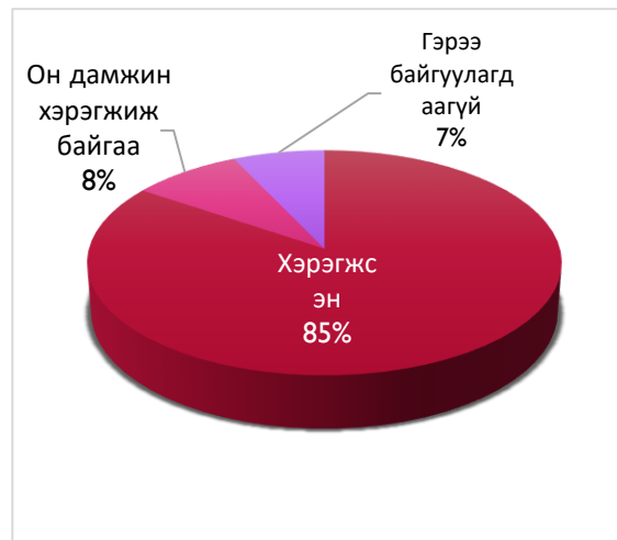
Дүрслэл 5. Төсөл, арга хэмжээний хэрэгжилт

Харин 7.0% буюу 568.5 сая төгрөгийн 5 төсөл, арга хэмжээ гэрээний дагуу он дамжин хэрэгжиж байгаа бол 8.5% буюу 320.0 сая төгрөгийн 6 төсөл, арга хэмжээний гэрээ байгуулагдаагүй, хэрэгжээгүй байна.