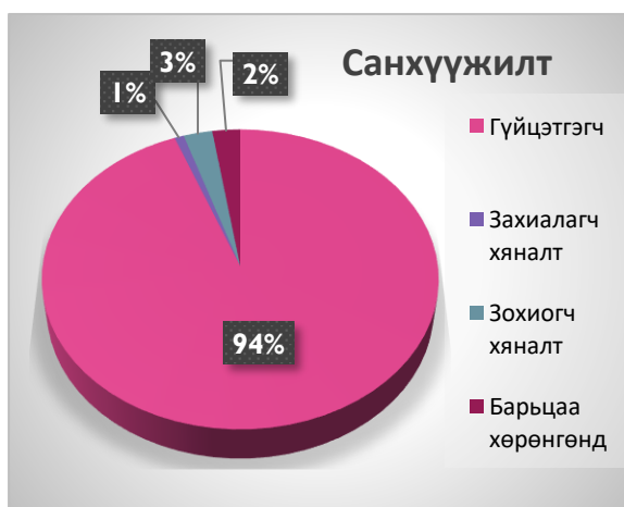
Дүрслэл 4. Төсөл, арга хэмжээний санхүүжилт

Тайлант онд хэрэгжсэн 66 төсөл, арга хэмжээнд нийт 9,885.3 сая төгрөгийн санхүүжилтийг олгосноос гүйцэтгэгчид 9,237.9 сая, захиалагчийн хяналтын зардалд 80.7 сая, зохиогчийн хяналтын зардалд 251.2 сая төгрөгийг олгож, 242.4 сая төгрөгийг барьцаа хөрөнгийн дансанд байршуулжээ.