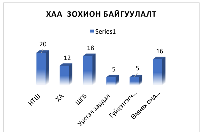
Дүрслэл 3. ХАА зохион байгуулалт

Шинээр хэрэгжих төсөл, арга хэмжээнээс 20 төсөл, арга хэмжээг нээлттэй тендер шалгаруулалтын аргаар, 12 төсөл, арга хэмжээг харьцуулалтын аргаар, 18 төсөл, арга хэмжээг гэрээ шууд байгуулах аргаар худалдан авах ажиллагааг зохион байгуулж гүйцэтгэгийг сонгон шалгаруулсан байна. Үлдсэн 10 төсөл, арга хэмжээнээс 5 нь урсгал зардлын шинжтэй арга хэмжээг төлөвлөсөн бол 5 нь худалдан авах ажиллагаанд оролцогч ороогүй, батлагдсан төсөвт өртөг нь тухайн ажлыг гүйцэтгэхэд хүрэлцэхээр хэмжээнд төлөвлөөгүйгээс худалдан авах ажиллагааг зохион байгуулаагүй байна.