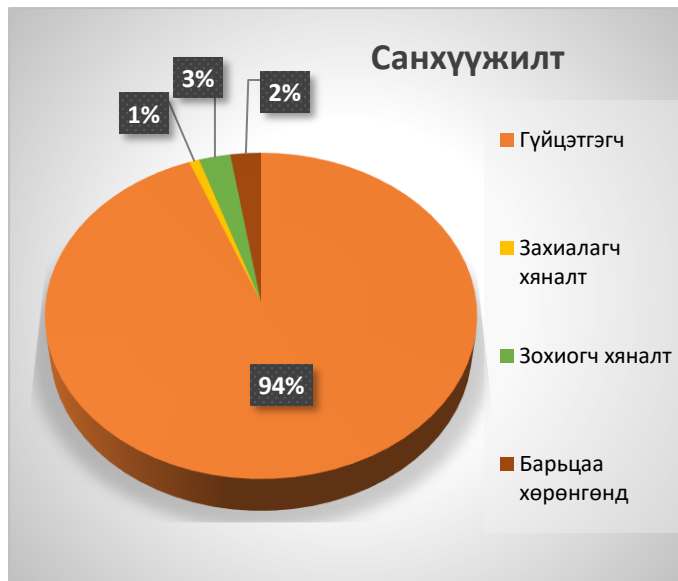
Дүрслэл 4. Төсөл, арга хэмжээний санхүүжилт

Тайлант онд бүрэн болон дутуу хэрэгжсэн 66 төсөл, арга хэмжээнд нийт 9,885.3 сая төгрөгийн санхүүжилтийг олгосон байна. Үүнээс ажлын гүйцэтгэлд 9,237.9 сая, захиалагчийн хяналтын зардалд 80.7 сая, зохиогчийн хяналтын зардалд 251.2 сая төгрөгийг олгож 242.4 сая төгрөгийг барьцаа хөрөнгийн дансанд байршуулжээ.