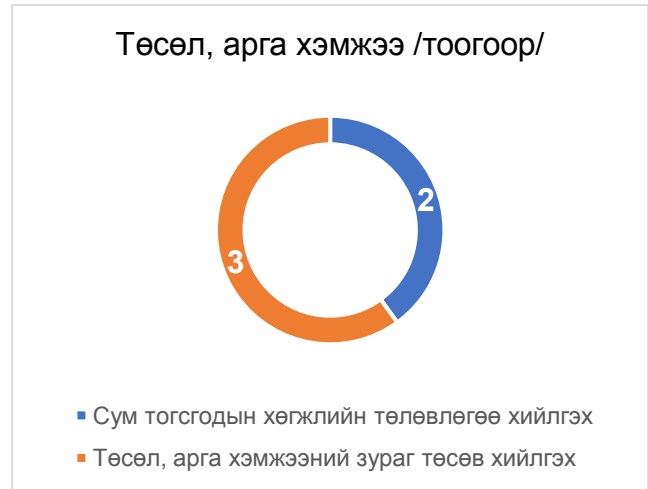
Дүрслэл 2. Зураг төслийн ажлууд

Аймгийн ИТХ-аас баталсан орон нутгийн хөрөнгө оруулалтаар хэрэгжүүлэх 37 төсөл, арга хэмжээг албан байгууллагаас ирүүлсэн хүсэлт, баримт бичигт үндэслэн аймгийн Засаг даргын удирдлагын зөвлөлөөр ач холбогдол, нэн тэргүүний хэрэгцээ шаардлагатай төсөл, арга хэмжээг эсэхийг хэлэлцэж төлөвлөж байна.