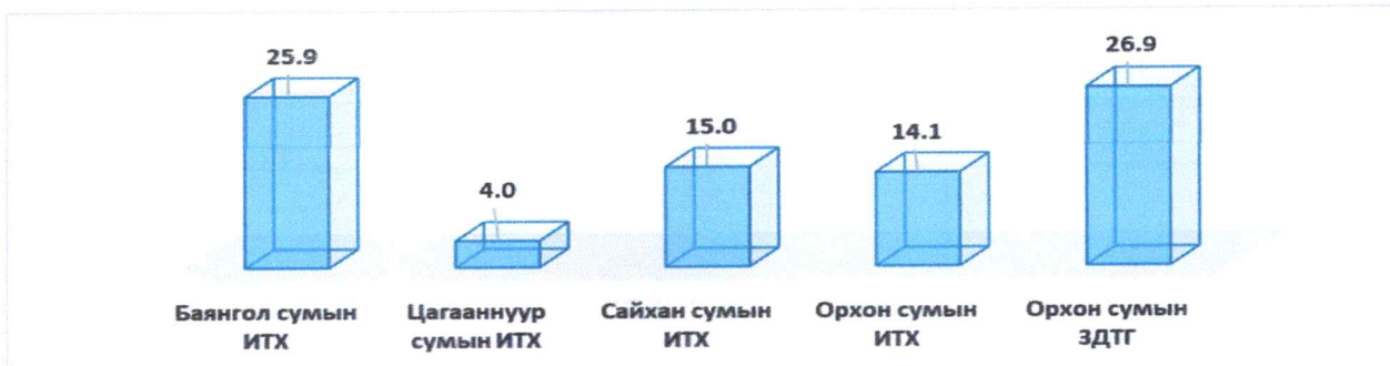
Эх сурвалж: Сумдын ИТХ-ын төсөв баталсан тогтоолууд

Энэ нь Төсвийн тухай хуулийн 34 дугаар зүйлийн 34.2 дахь “Засаг дарга дараах тохиолдолд тухайн жилийн төсвийн тодотголыг боловсруулж, тухайн шатны иргэдийн Төлөөлөгчдийн Хуралд өргөн мэдүүлнэ”, 34.2.2: “Урьдчилан тооцох боломжгүй нөхцөл байдлын улмаас төсвийн орлого буурах, зарлага нэмэгдэж, орон нутгийн төсөв алдагдалтай болох нөхцөл байдал бий болсон” гэсэн заалтыг зөрчсөн байна.