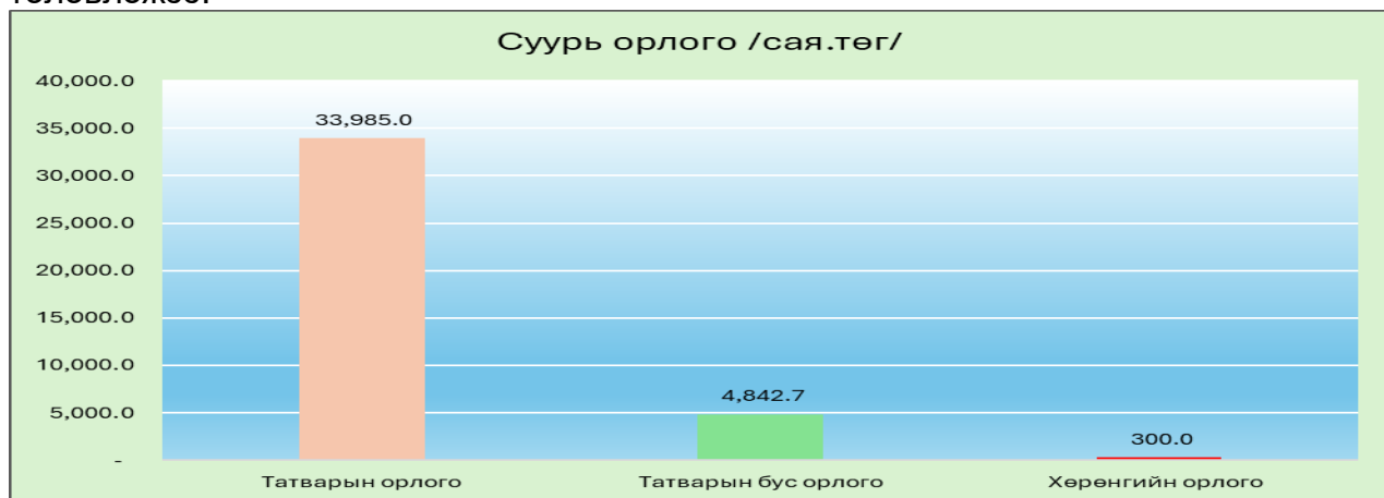
График 1. Суурь орлогын бүрдүүлэлт /сая.төг/

Орон нутгийн төсвийн суурь орлогын 86.8 хувийг татварын орлогоос, 12.4 хувийг татварын бус орлогоос, 0.8 хувийг хөрөнгийн орлогоос бүрдүүлэхээр төлөвлөжээ.