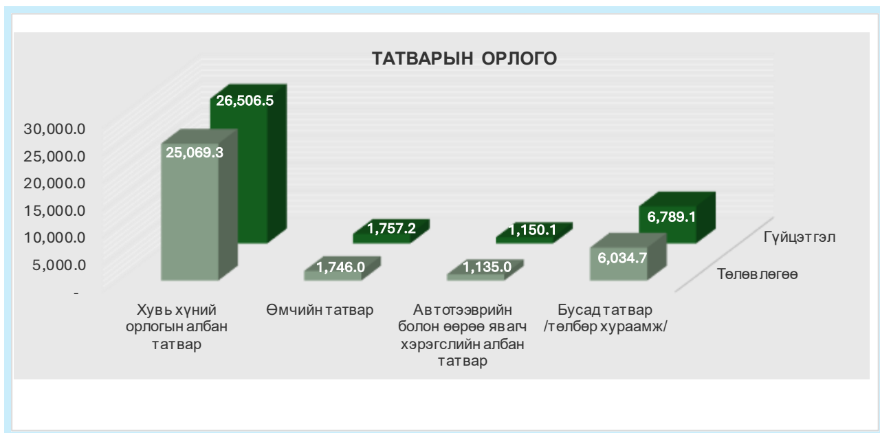
График 4. Татварын орлогын төлөвлөгөө, гүйцэтгэл

Татварын орлогын төлөвлөгөө гүйцэтгэлийг графикаар харуулбал дараах байдалтай байна.