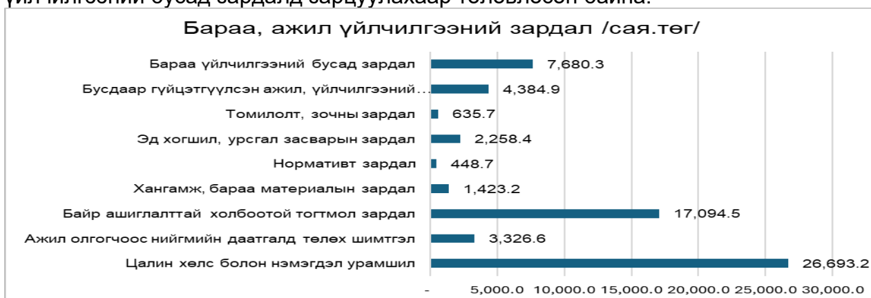
График 3. Бараа үйлчилгээний зардлыг нэр төрөл/ сая.төг/

Бараа, ажил үйлчилгээний зардлын 41.8 хувийг цалин хөлс болон нэмэгдэл урамшуулал, 5.2 хувийг ажил олгогчоос нийгмийн даатгалд төлөх шимтгэл, 26.7 хувийг байр ашиглалттай холбоотой тогтмол зардал, 2.2 хувийг хангамж, бараа материалын зардал, 0.7 хувийг норматив зардал, 3.5 хувийг эд хогшил, урсгал засварын зардал, 1.0 хувийг томилолт, зочны зардал, 6.9 хувийг бусдаар гүйцэтгүүлсэн ажил, үйлчилгээний төлбөр, хураамжийн зардал, 12 хувийг бараа үйлчилгээний бусад зардалд зарцуулахаар төлөвлөсөн байна.