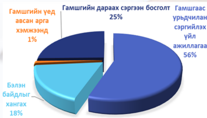
Дүрслэл № 5: Гамшгаас хамгаалах зардлын гүйцэтгэл

Гамшгаас хамгаалах зардлыг урьд онтой харьцуулахад төлөвлөгөө 300.0 сая төгрөг буюу 54.6 хувь, гүйцэтгэл 200.2 сая төгрөг буюу 45.3 хувиар өссөн байна. Энэ нь тайлант жил өмнөх оноос харьцангуй цаг агаарын аюулт үзэгдэл, үерийн гамшиг бага тохиолдсонтой холбоотой байна.