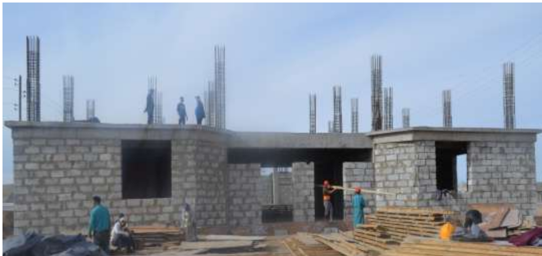
Зураг 1.Хашаат сумын Соёлын төвийн барилгын ажил 2019.03.31

Энэхүү илүү санхүүжилт авах зорилгоор “Хатуу төмөр” ХХК-ний огт хийгдээгүй ажлууд болох 2-р давхарын угсралт, дээвэр, хаалга цонх, дотор гадна заслын ажил, шалны ажил зэргийг хийсэн гэж бодит гүйцэтгэлээс хэт их зөрүүтэй гаргасан “ хуурамч гүйцэтгэл ”-ийг захиалагчийн хяналтын инженер нь холбогдох журамд заасан эрх үүргийг хэрэгжүүлэхгүйгээр тухайн жилийн батлагдсан санхүүжилт 1.0 тэрбум төгрөгийг бүрэн олгуулахаар баталгаажуулсан байна. Түүнчлэн аймгийн ГХБХБГ, ЗДТГ-ын ХОХБТХ, СТСХ-ийн дарга, холбогдох мэргэжилтнүүд энэхүү “ хуурамч гүйцэтгэл ” бүхий санхүүжилт хүссэн материалыг бодит гүйцэтгэлтэй харьцуулан шалгахгүйгээр “Хатуу төмөр” ХХК-д 991.4 сая төгрөгийн санхүүжилт олгосон нь 2018 онд бодит хийсэн ажлын гүйцэтгэлд тохирох санхүүжилтээс урьдчилсан тооцоогоор 535.5 сая төгрөгөөр илүү байна.