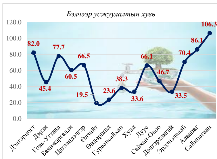
График № 3 3

Мөн мал угаалгын ванны хэрэгцээ шаардлагыг судлахад 12 суманд 29 мал угаалгын ванн дутагдалтай байна. Судалгааг график 3-аар харууллаа. Үүнд: