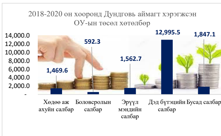
График № 1

Олон улсын байгууллагуудаас 2018 онд 1,309.3 сая төгрөг, 2019 онд 1,034.9 сая төгрөг, 2020 онд 16,123.0 сая төгрөгийн хөрөнгө оруулалт хийгдсэн байна. Хөрөнгө оруулалт, ТАХ-ний 8.0 хувь нь хөдөө аж ахуйн салбарт, 8.5 хувь нь эрүүл мэндийн салбарт, 3.2 хувь нь боловсролын салбарт, 70.4 хувь нь дэд бүтцийн салбарт, 10 хувь нь бусад салбарт хийгдсэн байна.